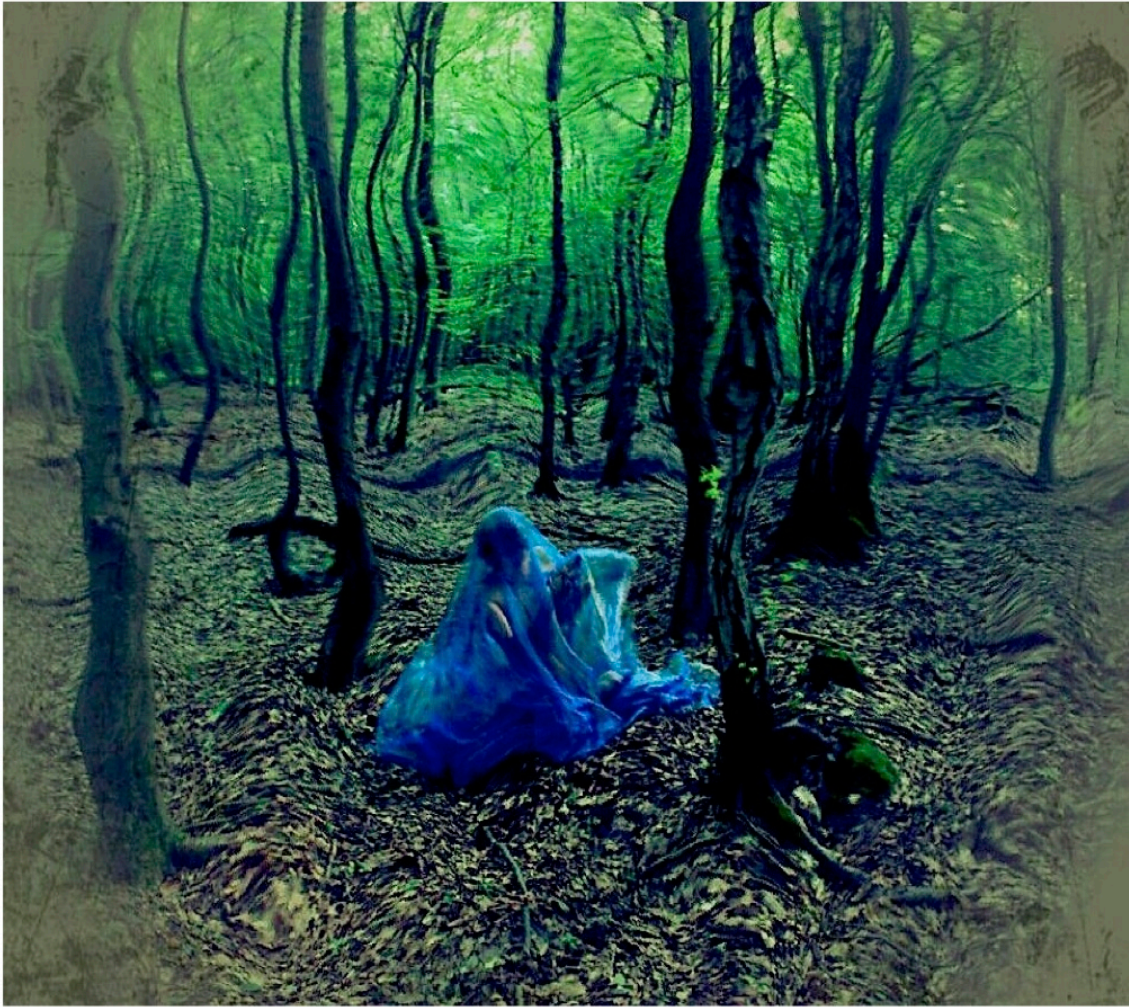
1 Photo pendant le tournage "le mouvement crée l'espace".2012